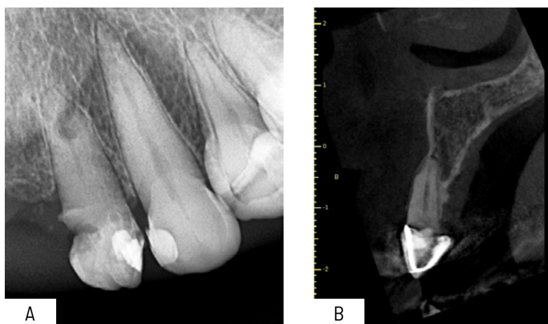
Figura 1. Evaluación radiográfica y tomográfica. A: Radiografía periapical mostrando calcificación de tercio cervical radicular de pieza 2.2; B: Corte tomográfico sagital mostrando claramente calcificación del tercio cervical radicular

diográficamente se pudo observar calcificación del tercio cervical del conducto radicular (Figura 1A).