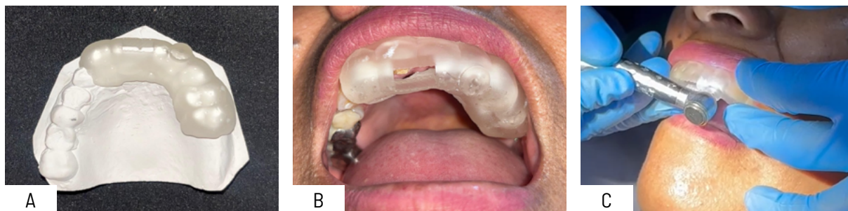
Figura 3. Prueba clínica y adaptación de la guía endodóntica en modelo y en boca. A: Vista de la guía impresa y adaptada en modelo; B: Vista de la guía impresa y adaptada en el paciente; C: Apertura endodóntica guiada mediante guía impresa en 3D.

y se realizó la apertura con una piedra diamantada para alta velocidad FG 1014HL (Option) ya que esta posee un diámetro igual de 1.5mm tanto en la parte activa como en el vástago inactivo (Figura 3C).